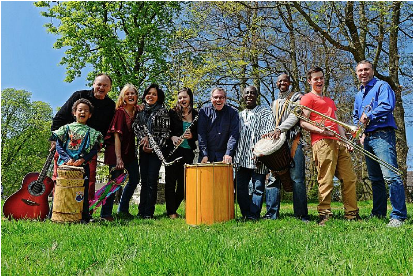
Die ABC-Jazzband for Kids