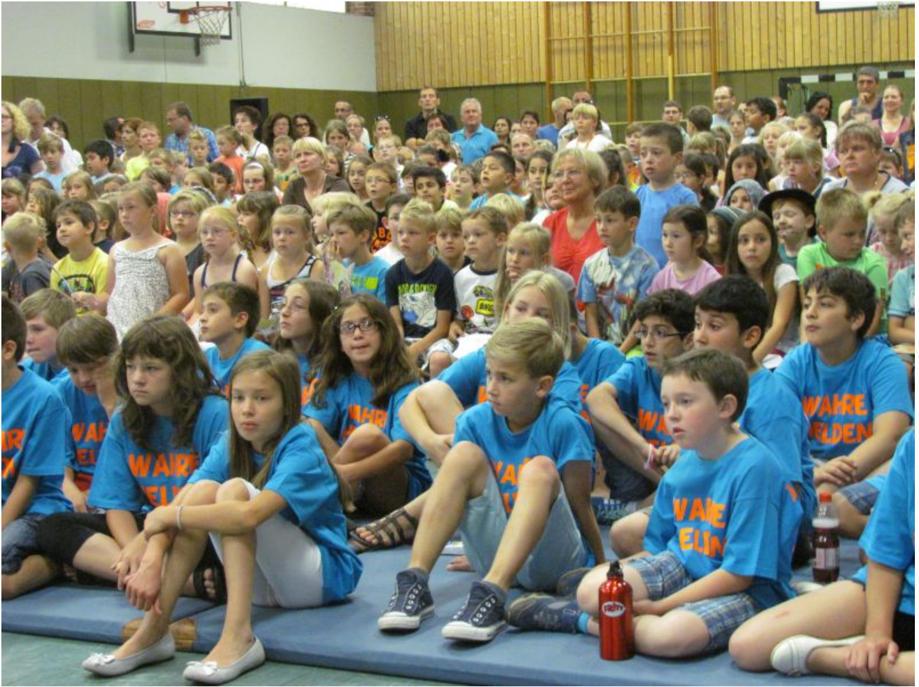
Schulabschlussfeier in der Turnhalle