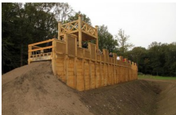
Holz-Erde-Maier in Oberaden

Auf den Spuren der „alten Römer“ können interessierte Bürgerinnen und Bürger am kommenden Sonntag, 14. April, wieder im Stadtteil Oberaden wandeln.