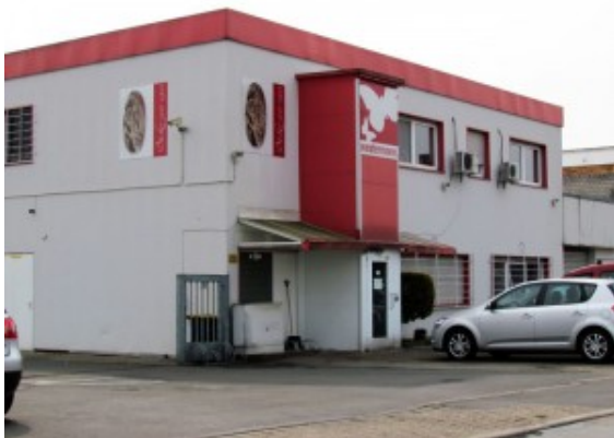
Bäckerei Westermann in Oberaden.