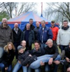
Es ist geschafft: Das Zirkuszelt steht.