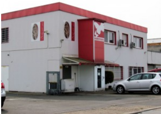
Bäckerei Westermann in Oberaden.