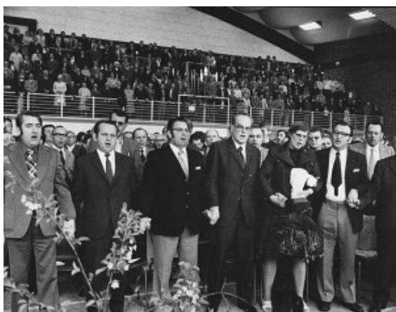
Herbert Wehner unterstützte

Die Feiern zum 1. Mai haben in vielen Städten den Charakter eines Volksfests angenommen. Das war vor genau 40 Jahren in Bergkamen und Kamen ganz anders. Der 1. Mai 1973 war ein Kampftag: Kurz vorher waren die Pläne der Ruhrkohle AG bekannt geworden, das Bergwerk Monopol in Kamen wie viele andere im Ruhrgebiet auch zu schließen.