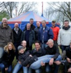
Es ist geschafft: Das Zirkuszelt steht.