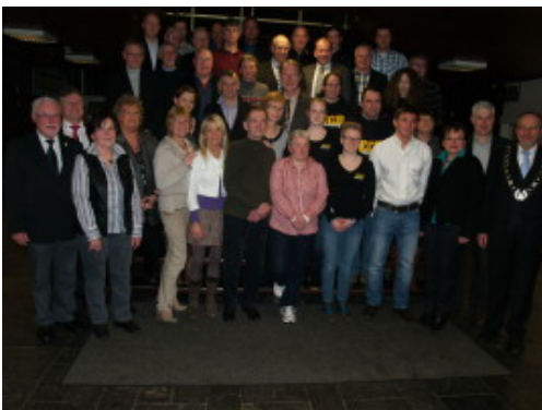
Sportlerehrung im Treffpunkt