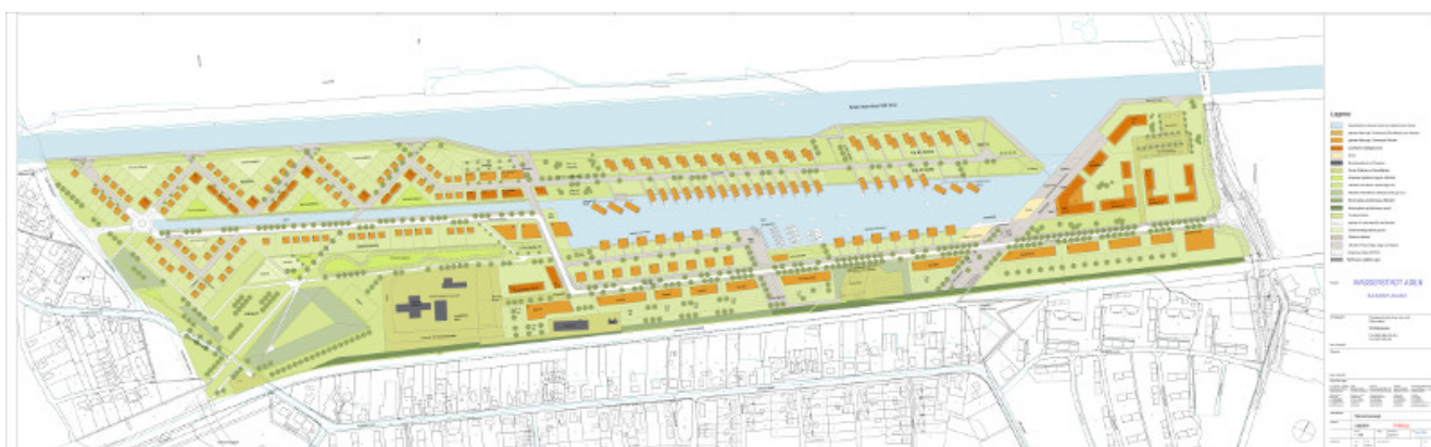
Konzept der Wasserstadt Aden

Für den Besuch wird zu festem Schuhwerk geraten, da es sich um eine zum Großteil nicht befestigte Brachfläche handelt. Aufgrund der begrenzten Parkmöglichkeiten wird den Besuchern aus der Nachbarschaft die Anreise mit dem Rad empfohlen.