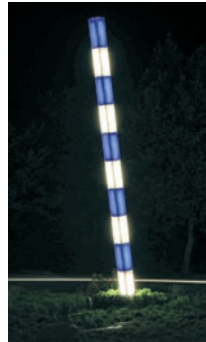
Rünther Tor Kreisverkehr mit blau-weißem Maßstab