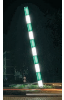
Oberadener Tor Kreisverkehr mit grün-weißem Maßstab