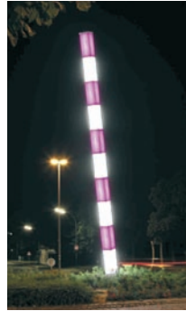
Weddinghofer Tor Kreisverkehr mit magenta-weißem Maßstab