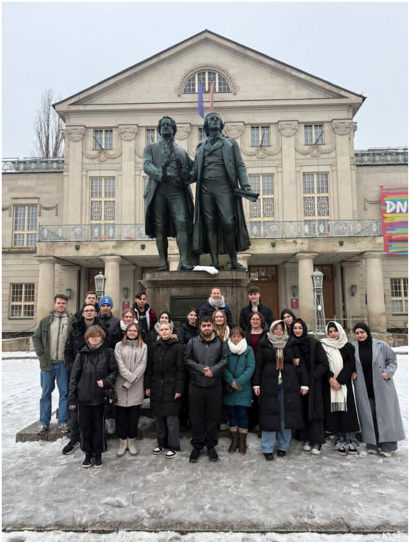
Im Februar unternahmen die Geschichts-Leistungskurse der Jahrgangsstufen Q1 und Q2 der Willy-Brandt-Gesamtschule eine