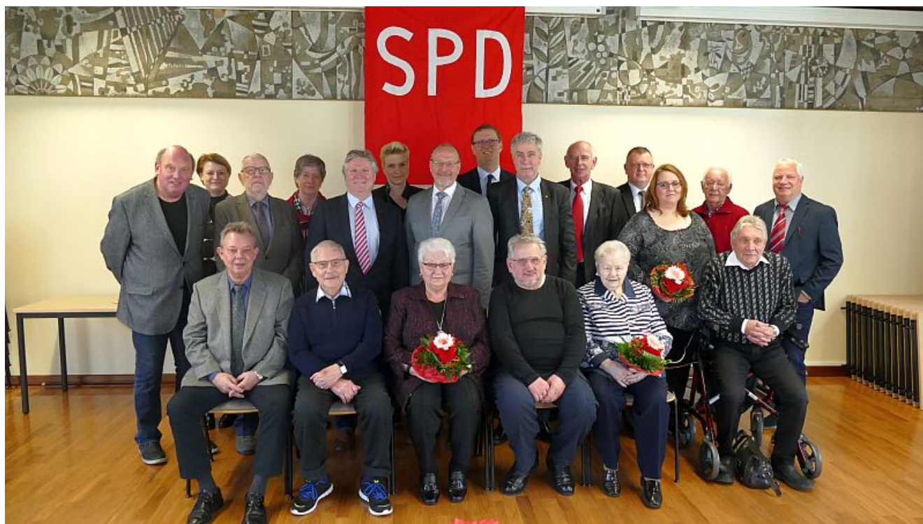
Die Jubilare des SPD-Ortsvereins Bergkamen-Mitte.

Der SPD-Ortsverein Bergkamen-Mitte hat in einer Feierstunde am Sonntagmorgen im Treffpunkt zahlreiche Mitglieder geehrt, die in den Jahren 2017 und 2018 auf ein „rundes“ Parteiubiläum blicken konnten. Die Laudatio hatte der Bundestagsabgeordnete und Unterbezirkvorsitzende Oliver Kaczmarek übernommen.