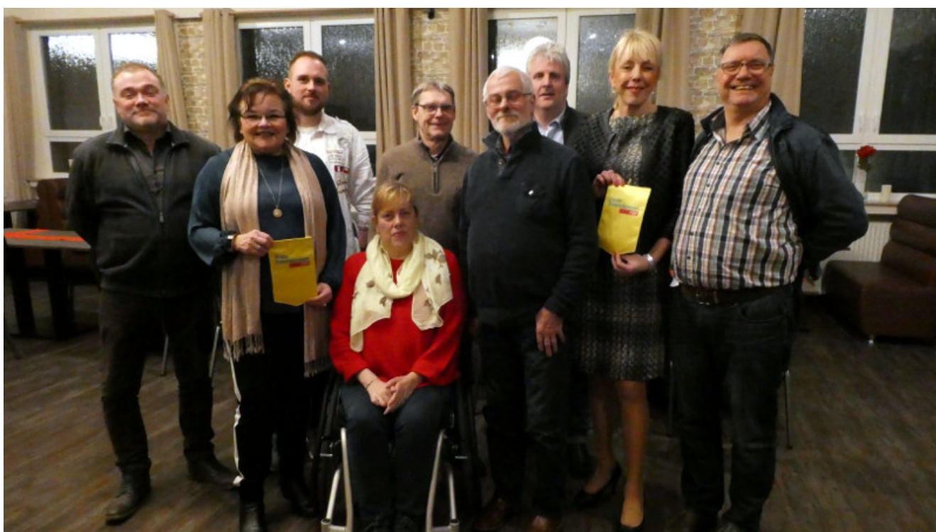
Ortsparteitag der Bergkamener FDP.

Am Donnerstag fand der Ortsparteitag der Bergkamener Liberalen im Restaurant Olympia in Bergkamen-Weddinghofen statt. Neben den heimischen Liberalen besuchte auch die Landtagsabgeordnete