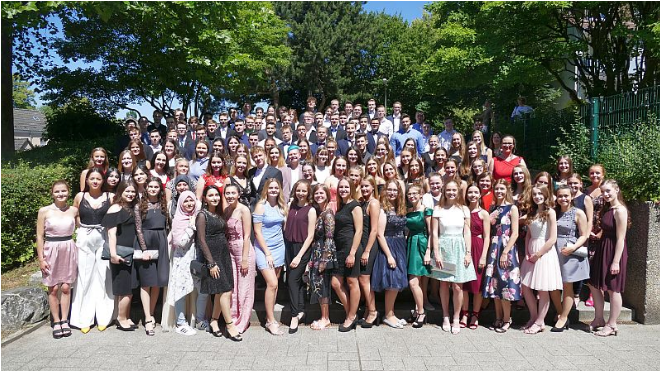
Der Abi-Jahrgang 2018 des Städtischen Gymnasiums Bergkamen.

Wieder einmal hätte das PZ nicht ausgereicht, die vielen Gäste bei der Abitur-Feier mit Zeugnisausgabe auch nur annähernd aufzunehmen. Die 119 Abiturientinnen und Abiturienten des Jahrgangs 2018 des Städtischen Gymnasiums Bergkamen erhielten deshalb in der Friedrichsberg-Sporthalle ihre Zeugnisse der Allgemeinen Hochschulreife. Viel Applaus gab es von den Eltern, Verwandten und Freunden auf der Zuschauertribüne, die praktisch bis auf den letzten Platz besetzt war, als die erfolgreichen jungen Frauen und Männer unter den Klängen von Verdis Triumphmarsches, gespielt vom Bachkreis, in die Halle einzogen.